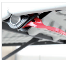
Sistema di sicurezza