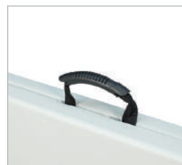
Trasportabile con maniglia