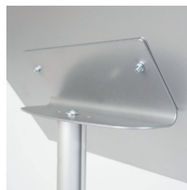
CONNESSIONE PROFILO PORTA AVVISO

Leggio interamente in metallo con base verniciata a polveri silver diametro 350 mm, montante in alluminio anodizzato silver e leggjo verniciato a polveri silver per formato A3 orizzontale con mensola reggi-libro da 45 mm. Un espositore adatto per sostenere libri, brochure, riviste, informazioni, cataloghi da sfogliare, porta caratteristiche. Utilizzato all'interno di negozi, vetrine, punto vendita, hotel, ristoranti, ed in qualsiasi ambiente interno.