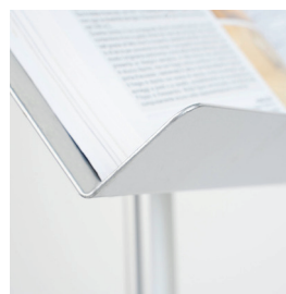
APPOGGIO REGGI LIBRO